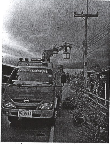
หมู่ที่ ๖ นายพงษ์ศักดิ์ ปานศรี