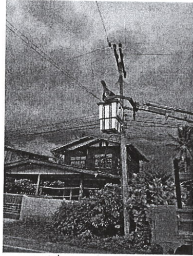
หมู่ที่ ๑ นายวิน ไหวพรม